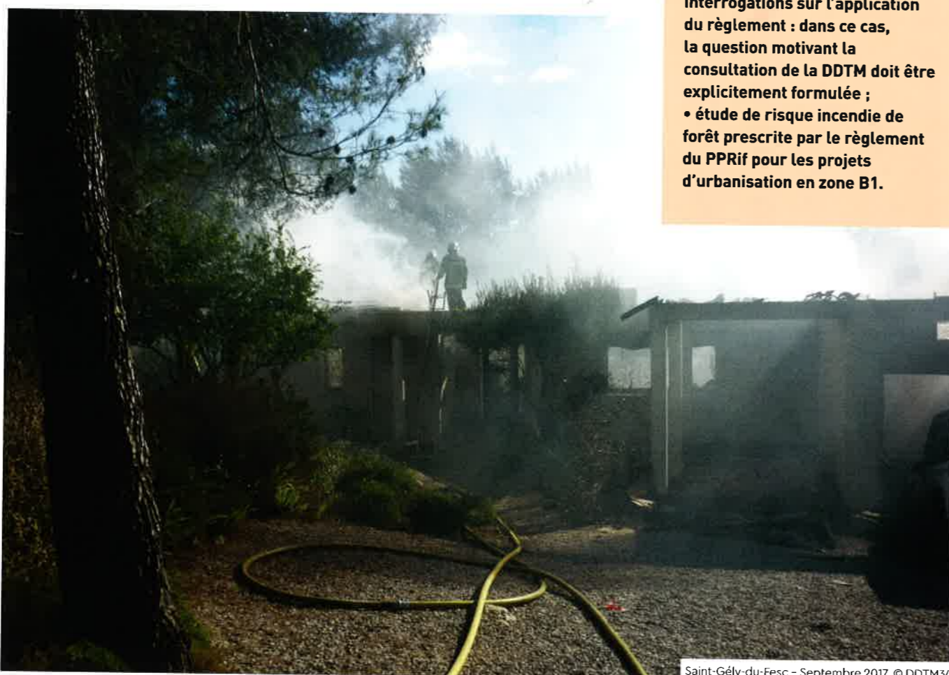
Saint-Gély-du-Fesc - Septembre 2017

Sur le site internet des services de l'État dans le département de l'Hérault ( www.herault.gouv.fr ), sont disponibles : • La carte départementale des PPRif approuvés : cartographie dynamique et carte au format PDF 11 . • Les PPRif approuvés : au format PDF et au format SIG 12 .