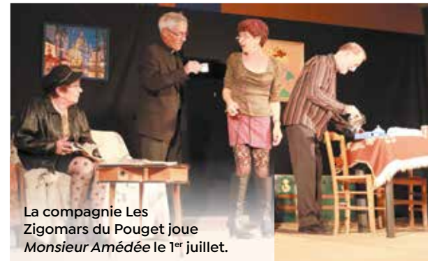
La compagnie Les Zigomars du Pouget joue Monsieur Amédée le 1 er juillet.