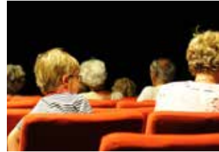
Cinéma Nestor Burma

2, rue Marcellin Albert - Montpellier Tramway ligne 3 station Celleneuve Bus Ligne 10 arrêt Celleneuve