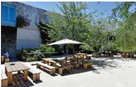
LA PANACÉE MO.CO.

Les chiens d'assistance et les cannes avec embout sont admis dans les espaces d'exposition.