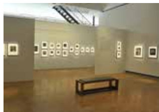
@ Montpellier Méditerranée Métropole

Esplanade Charles de Gaulle - Montpellier Tramway lignes 1 et 2 station Comédie