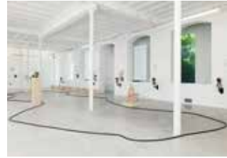
Exposition Pope.L Vue d'ensemble LA PANACÉE.MOCO, 2018