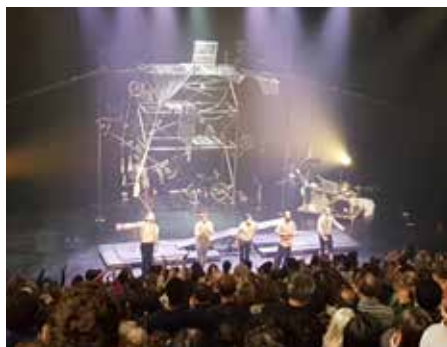
Machine de cirque

Bande de guidage pour les personnes malvoyantes.