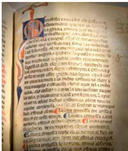
Reproduction du Petit Thalamus

L'ensemble des espaces est accessible aux Personnes à Mobilité Réduite.