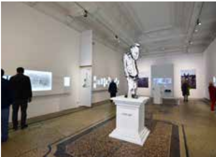
Exposition Fabcaro