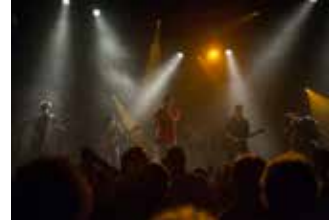
Victoire 2

Domaine du Mas de Grille 2, rue Théophraste Renaudot - Saint Jean de Védas Tramway ligne 2 station Victoire 2