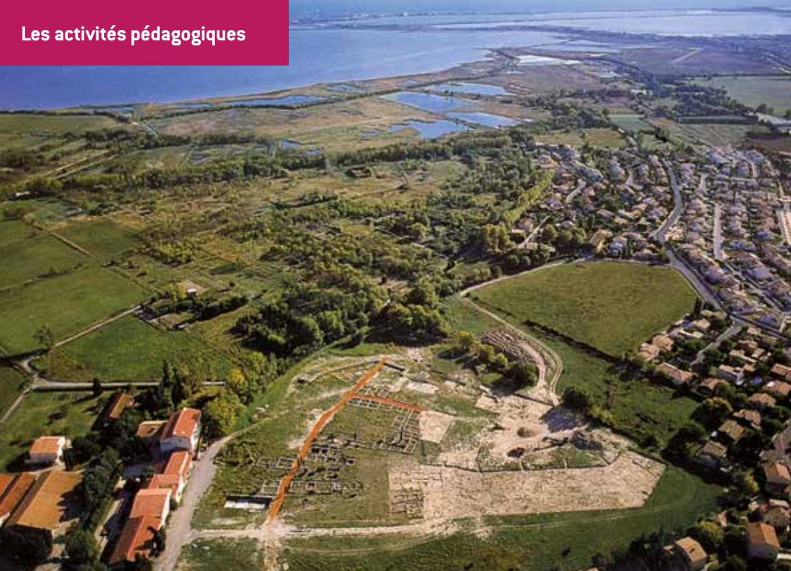
Vue aérienne du site archéologique ▲