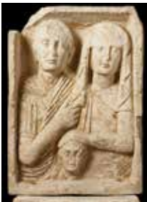
Stèle funéraire familiale, fin I er siècle avant notre ère

Des visites guidées du site archéologique, de la collection permanente et des expositions temporaires sont organisées, sur rendez-vous, par le Service éducatif-accueil des publics. Tél. 04 67 99 77 24 ou 04 67 99 77 26