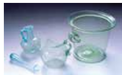
Verreries gallo-romaines, I er siècle.

Situé dans l'ancien mas Saint-Sauveur, aux abords de l'antique port de Lattara , le Site archéologique Lattara - Musée Henri Prades présente le résultat des fouilles archéologiques menées à Lattes par Henri Prades et le Groupe Archéologique Painlevé dès 1963, et par le CNRS depuis 1983. Le musée propose de découvrir ses collections d'objets de la vie quotidienne dans l'Antiquité (vaisselle, lampes à huile, outils, bijoux...), une très riche série d'objets en verre, des stèles funéraires, des statues... Tous ces objets témoignent de l'activité économique et commerciale du port de Lattara , de ses relations avec le monde méditerranéen (contacts avec le monde étrusque, centre de redistribution du commerce grec de Massalia ), de la vie quotidienne de ses habitants et de leurs rites funéraires. Des expositions temporaires réalisées en partenariat avec des musées français et étrangers sont régulièrement proposées.