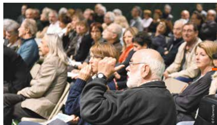
Les habitants de la métropole ont répondu présent aux dix réunions publiques organisées par la Métropole.