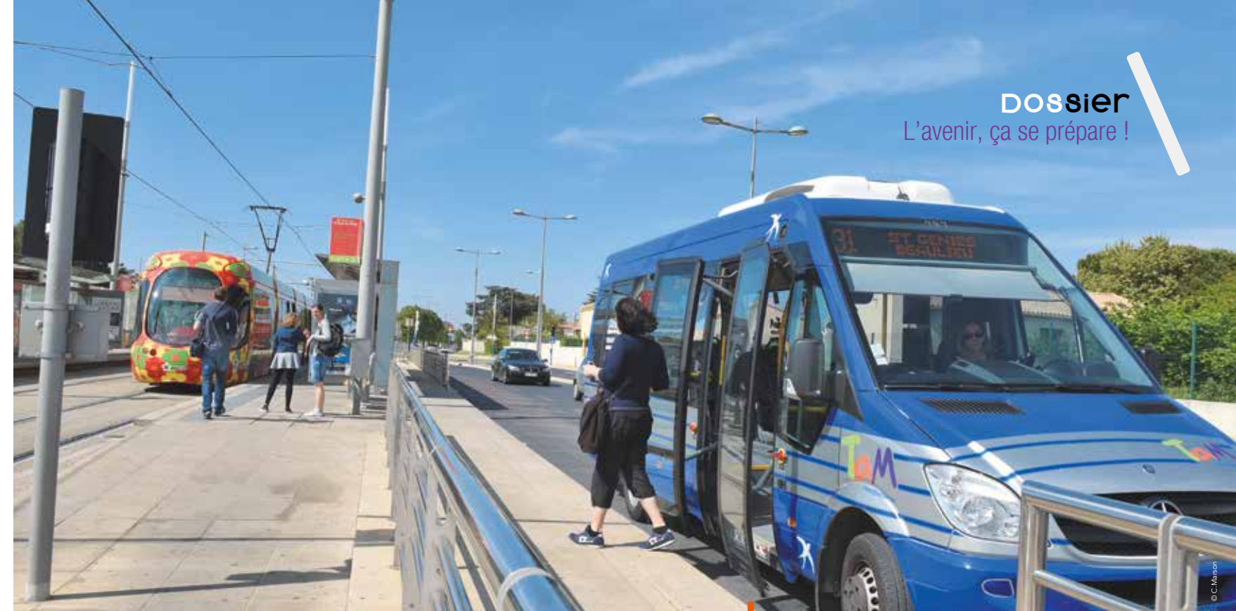
Le pôle d'échanges multimodal de Sablassou à Castelnaud-le-Lez concentre plusieurs moyens de transport propices à l'intermodalité.

Une nécessité face aux prix de vente et des loyers des logements libres élevés et qui ne baissent pas.