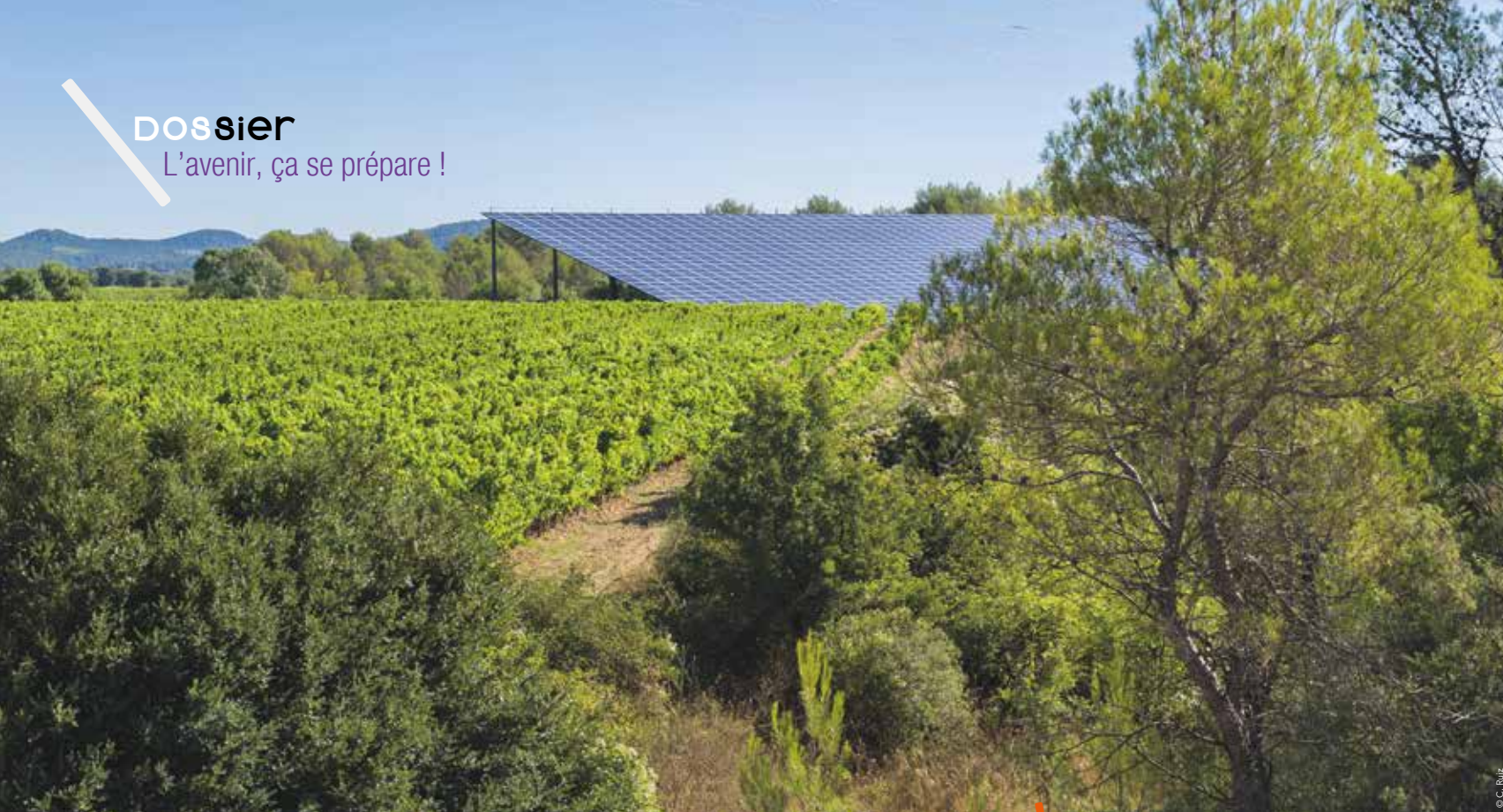
Préserver la biodiversité, ainsi que les surfaces agricoles, tout en assurant la transition énergétique.