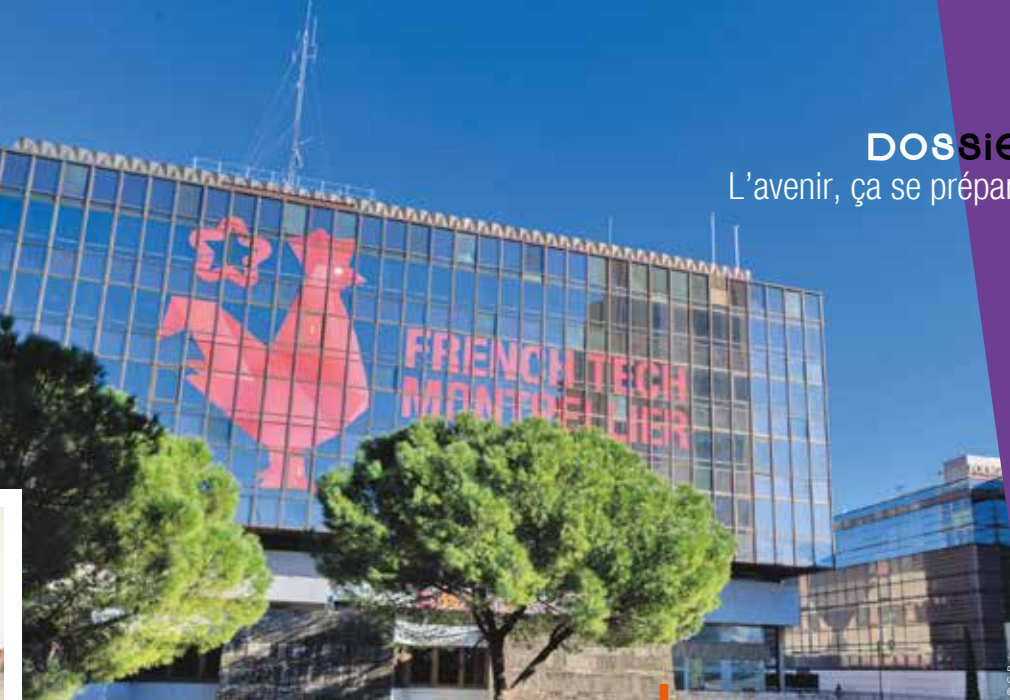
Les entreprises de la French Tech sont accueillies au centre-ville de Montpellier.