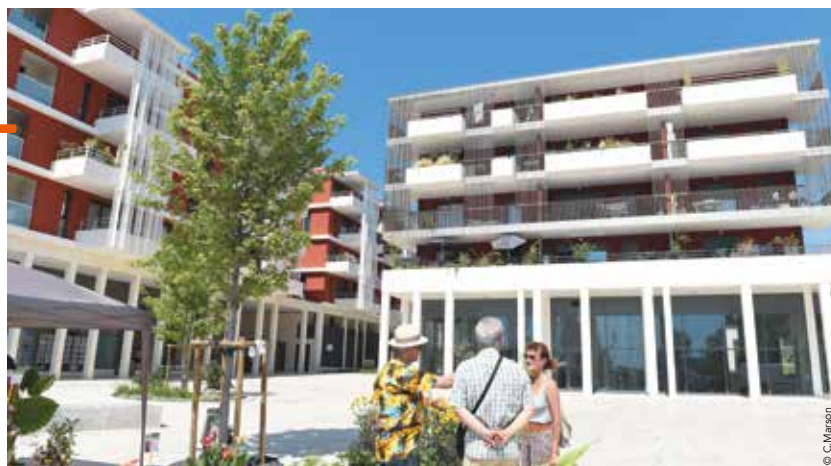
Ces cinq dernières années, le territoire a connu une croissance démographique de 1,77%, soit autant de nouveaux habitants à loger.

✓ À noter également, 60% des nouveaux logements seront construits sur les espaces déjà urbanisés, et proches des transports en commun. Des études sont, par exemple, en cours sur la future ligne 5 du tramway, dont l'enjeu est d'implanter des commerces, des logements et des activités tout au long du tracé.