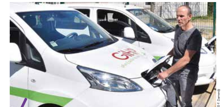
Le GIHP renouvelle progressivement sa flotte de véhicules avec des engins électriques.

Le Groupement pour l'Insertion des personnes Handicapées Physiques (GIHP) conforte sa démarche écologique. Son parc de véhicules, dédié au service de transport adapté des personnes en situation de handicap, compte désormais trois véhicules électriques. Pour optimiser son service auprès de ses 1 248 adhérents, le GIHP a réalisé un parking réservé à la recharge en mode rapide (30 minutes) et lent (8 heures) de ces nouveaux véhicules. Une réalisation qui a reçu le soutien de Montpellier Méditerranée Métropole grâce à une subvention de 47 000 euros.