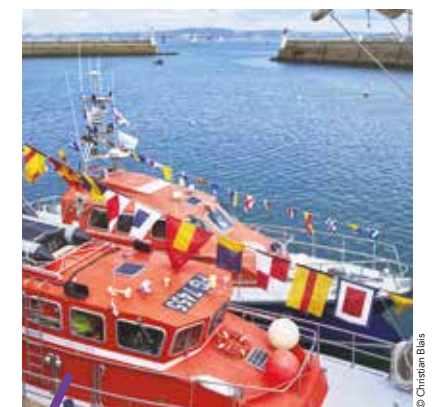
Les Sauveteurs en Mer interviennent bénévolement et gratuitement depuis plus d'un siècle au service de la population.

Pour ses cinquante ans, la Société Nationale de Sauvetage en Mer (SNSM) a été labélisée Grande Cause Nationale pour l'année 2017. À cette occasion Montpellier Méditerranée Métropole accompagne l'association, qui rassemble près de 7 000 sauveteurs bénévoles, dans le développement de ses ressources en relayant la nouvelle campagne de communication sur ses réseaux sociaux. snsm.org