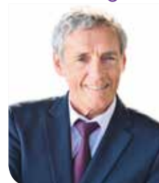
PHILIPPE SAUREL , président de Montpellier Méditerranée Métropole, maire de la Ville de Montpellier

“ Les études sont déjà en cours au nord de la ligne ”