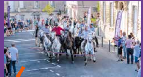
Une coupure de ruban à cheval.

C'est une abrivado menée par la manade Lafon de Saint-Nazaire-de-Pézan qui a coupé le ruban inaugural du plan des cafés le 6 juillet dernier à Saint Geniès des Mourgues. Un geste symbolique de l'attachement du village à la bouvine et aux traditions. Cette place centrale du village a été mise en valeur. Les principaux travaux ont consisté à la reprise du revêtement de cet espace public, la réalisation d'aménagements en pierre et l'installation de mobilier urbain. 290 000 euros ont été investis par la Métropole et la commune.