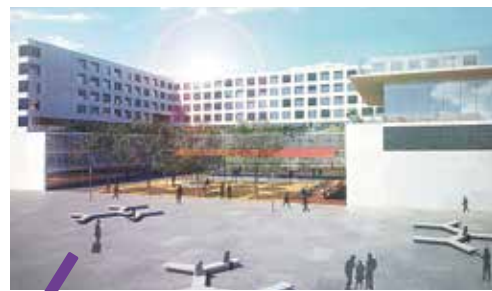
L'ESMA, école supérieure des métiers artistiques a acheté 7 110 m 2 de terrain dans la cité créative à Montpellier.