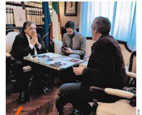
Leoluca Orlando et Philippe Saurel à Palerme.

Le 18 février, Philippe Saurel s'est rendu en Sicile le temps d'une rencontre avec Leoluca Orlando, maire de la ville métropolitaine de Palerme, jumelée avec Montpellier depuis 2016. À travers ce déplacement, alors que l'Europe connaît actuellement une montée du fascisme, le président de la Métropole, maire de Montpellier, tenait à apporter un témoignage de soutien à son homologue qui combat les dispositions anti-migrants du gouvernement de Matteo Salvini. Ils ont également co-signé deux courriers pour que Montpellier candidate à Open arms, organisation catalane qui vient en aide aux migrants en Méditerranée et au Global parliament of Mayors, qui réunit des maires de tous les continents. Montpellier serait la première ville française.