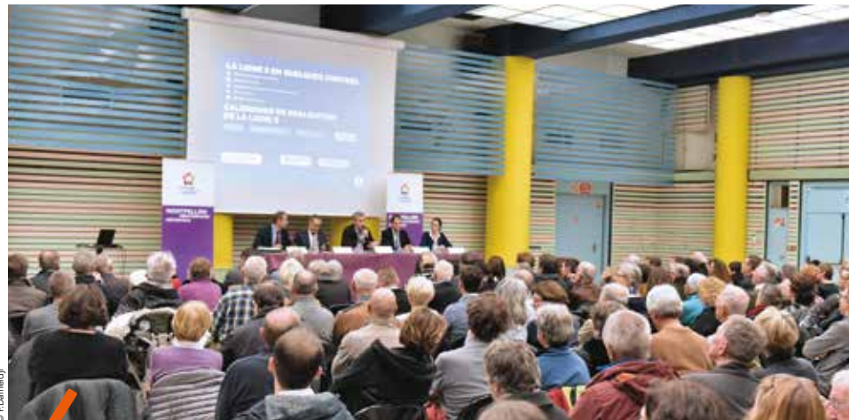
Une salle comble et satisfaite a suivi la présentation du tracé de la ligne 5 de tramway