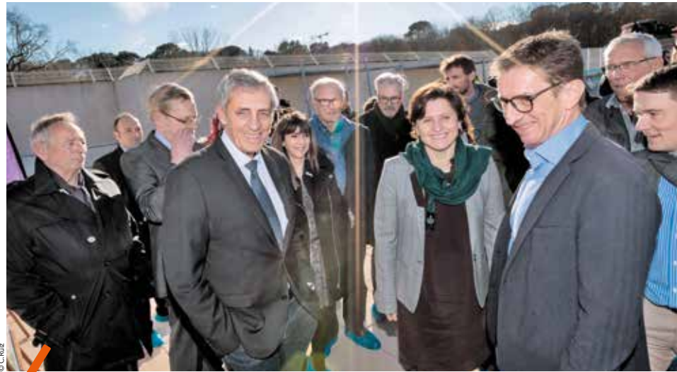
L'ancienne nageuse Roxana Maracineanu, ministre des Sports, s'est notamment rendue au centre nautique Neptune.