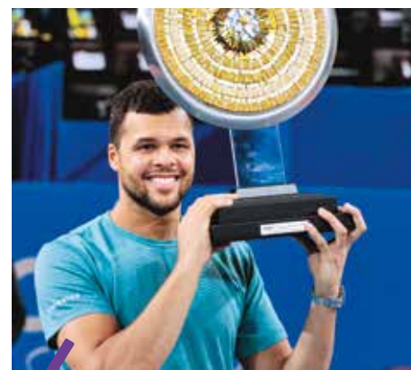
Jo-Wilfried Tsonga, vainqueur de l'Open Sud de France.