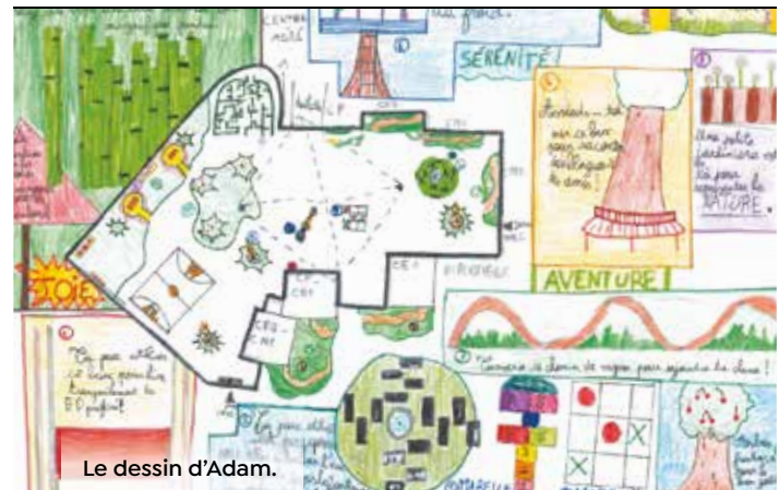
Le dessin d'Adam.