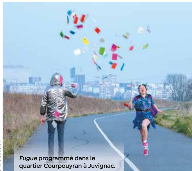
Fugue programmé dans le quartier Courpouyan à Juvignac.