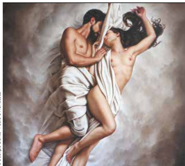
© Giorgio Dante - Paolo e Francesca