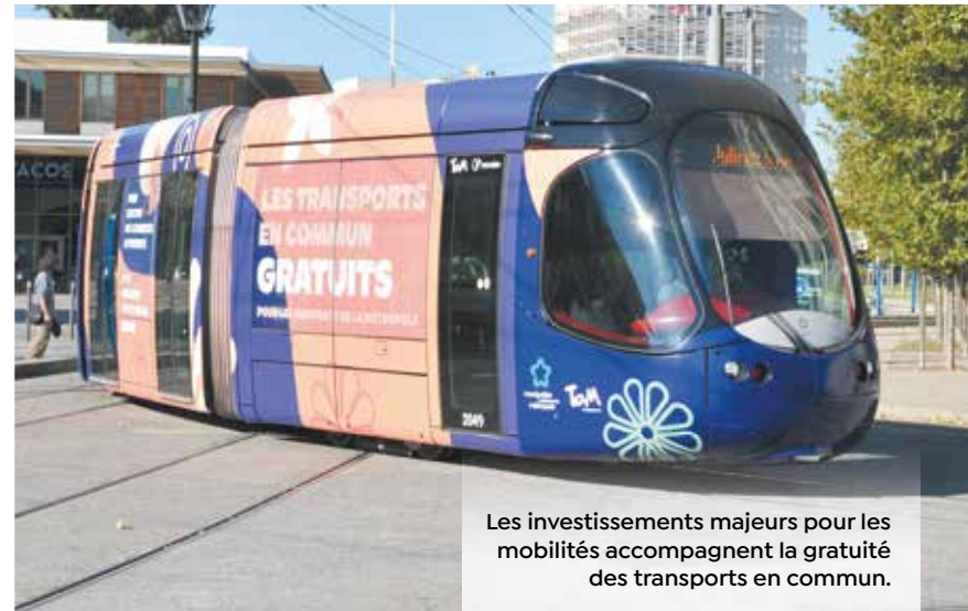
Les investissements majeurs pour les mobilités accompagnent la gratuité des transports en commun.