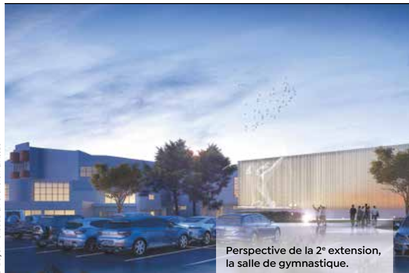
Perspective de la 2 e extension, la salle de gymnastique.