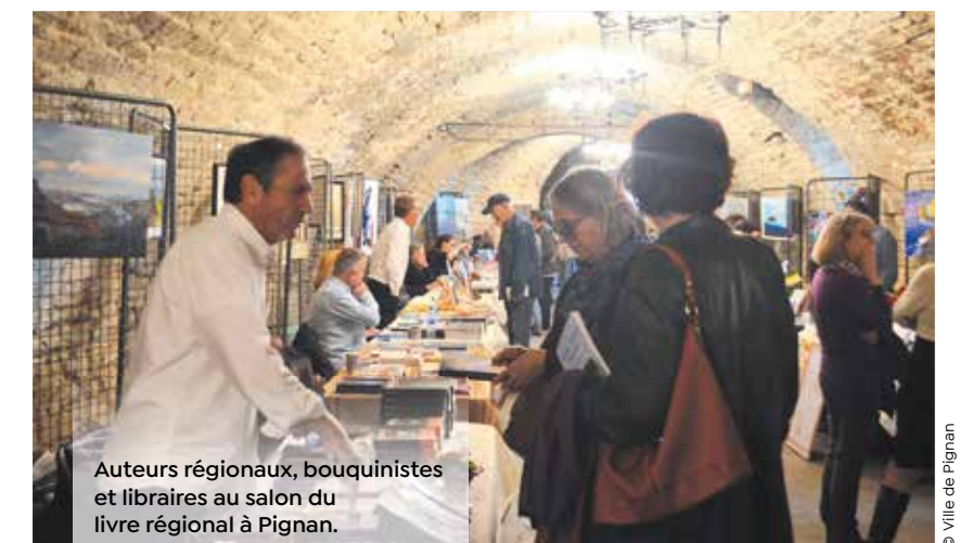
Auteurs régionaux, bouquinistes et libraires au salon du livre régional à Pignan.